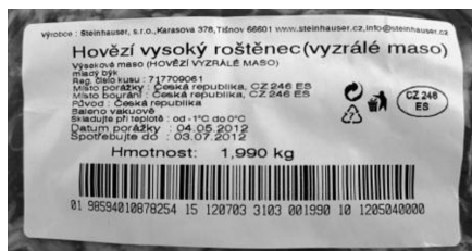
Příklad správného označení hovězího výsekového masa